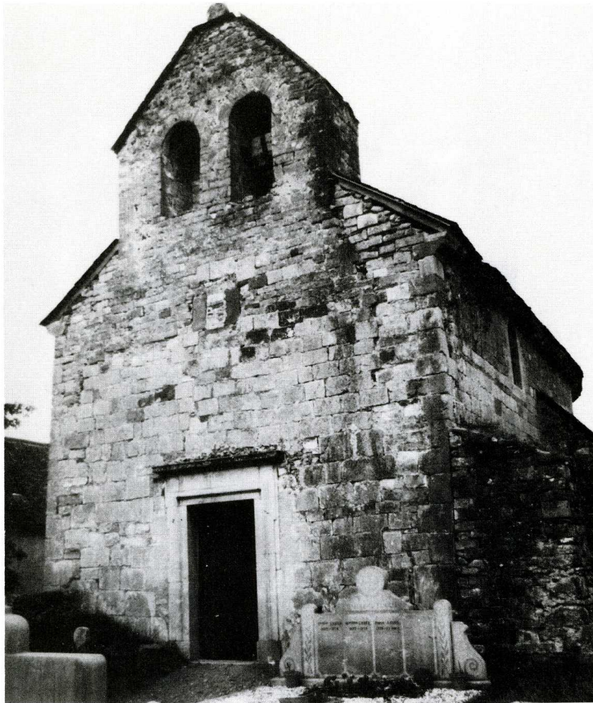
Lichans-Sunhar (Pyrénées-Atlantiques). Église paroissiale Saint-Pierre à Sunhar.

locale de sauvegarde s'est constituée pour éviter la ruine de plusieurs églises de cette région, construites sous l'influence du monastère de Sainte-Engrâce-du-Port, au diocèse de Lescar. L'église de l'ancien village de Sunhar est la mieux conservée, nous écrit son desservant, M. l'Abbé Roger Idiart. Elle n'est pas grande (20 x 7 m) et sa nef est couverte d'une simple charpente, mais ses murs épais et admirablement appareillés conviendraient à une construction entièrement voûtée. Le tympan de la porte sud, converti en fenêtre, est orné d'un beau chrisme roman. La corniche et ses modillons sont d'excellente proportion. L'église a conservé son ancien cimetière où l'on remarque deux stèles discoïdales. La restauration du clocher, de la toiture et des murs goutterots représente une somme élevée. Aux fonds versés par le Conseil général, l'association locale et le généreux desservant, s'ajoute une subvention de la Sauvegarde s'élevant à 60 000 F.