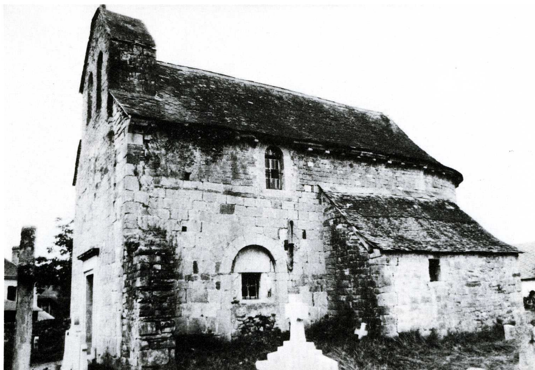
Lichans-Sunhar (Pyrénées-Atlantiques). Église paroissiale Saint-Pierre à Sunhar.