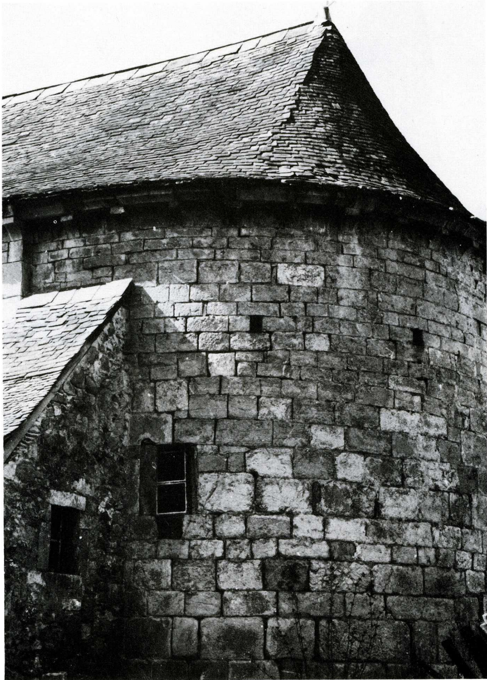
Lichans-Sunhar (Pyrénées-Atlantiques). Église paroissiale Saint-Pierre à Sunhar.