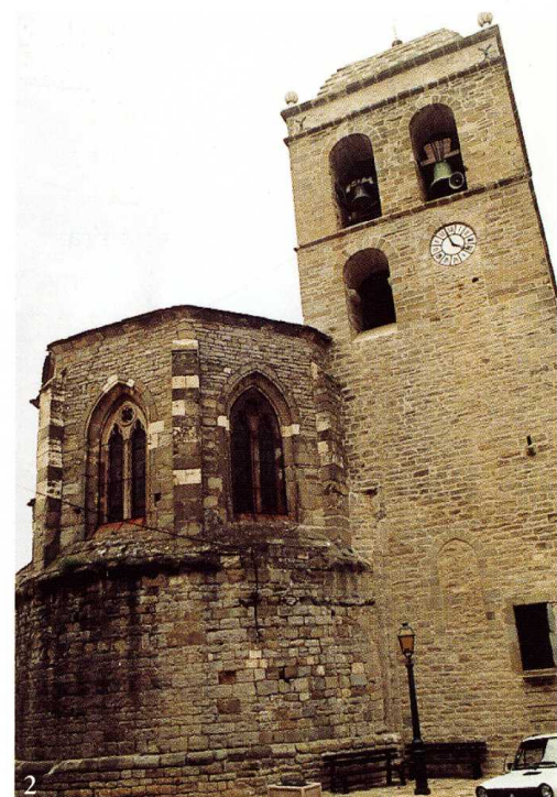
La Livinière (Hérault) Église Saint-Étienne 1. Façade sud et porche 2. Chevet de l'église et clocher

(dont la voûte en cul-de-four a disparu), surmonté ensuite d'un ouvrage gothique à trois pans percé de baies à remplages, et voûté d'ogives. La nef possède encore une partie de ses murs romans, en particulier le mur nord, et est voûtée d'un berceau brisé sur doubleaux qui est peut-être une reconstruction beaucoup plus tardive ; elle a été prolongée vers l'ouest d'une travée supplémentaire au XIX e siècle.