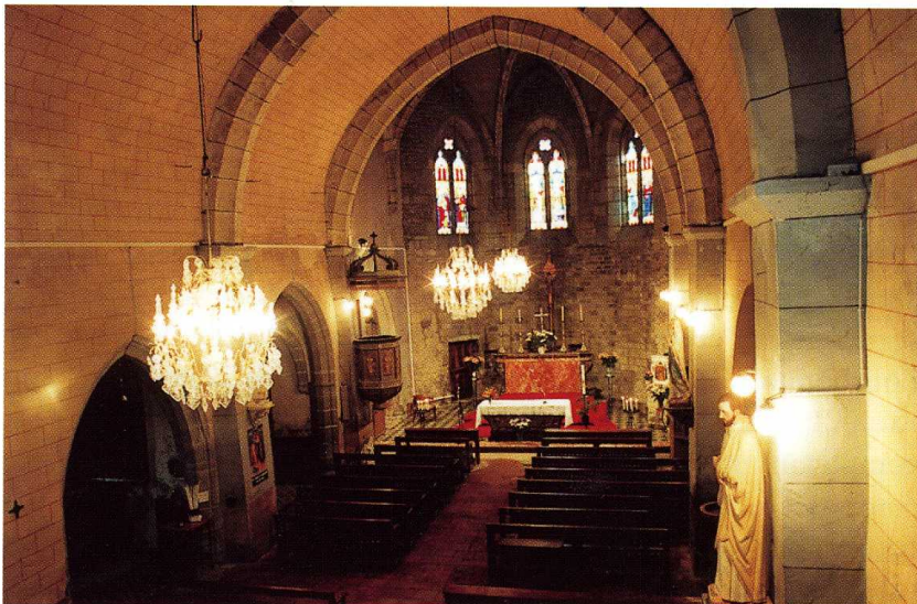
3. Désordres d'une voûte d'une chapelle