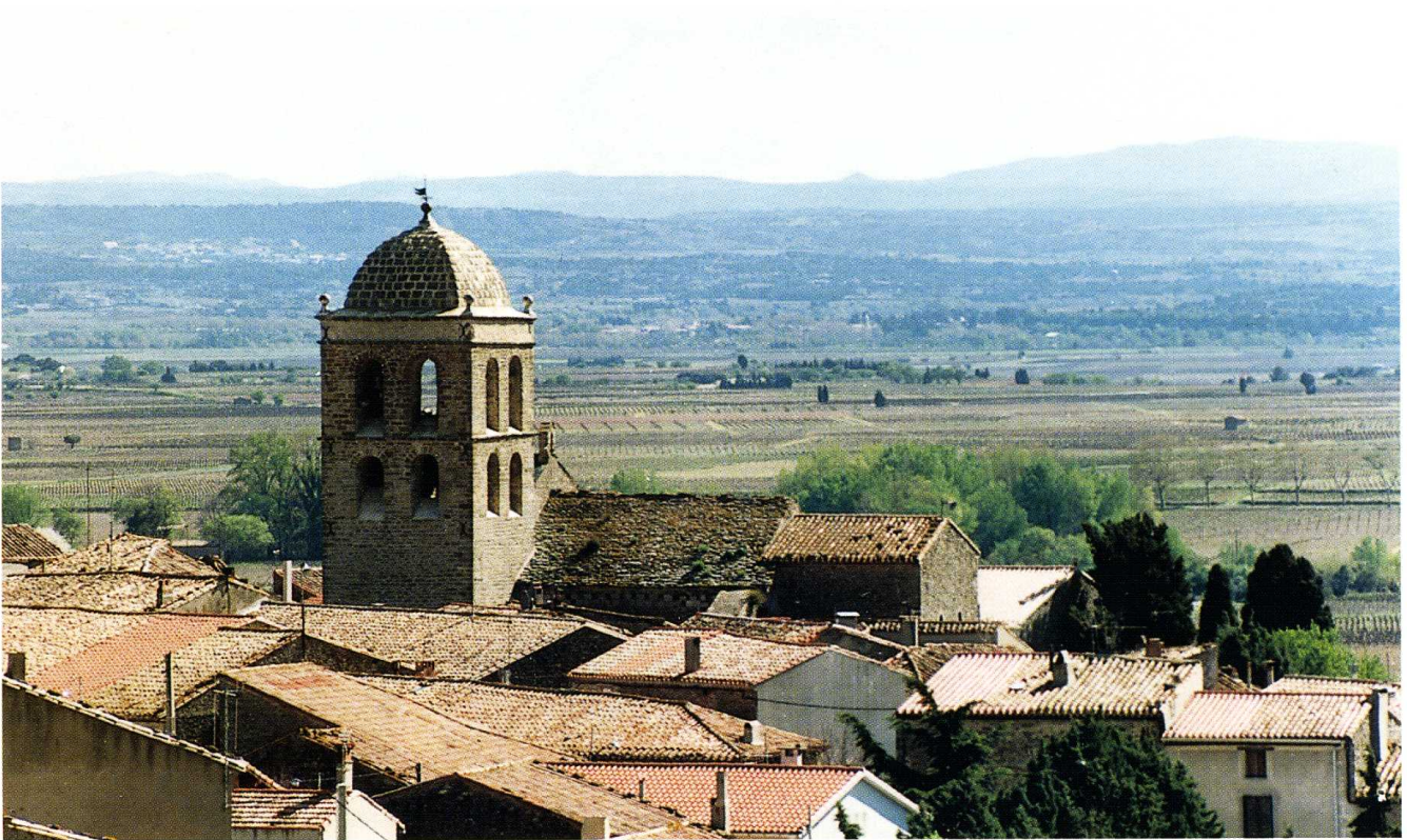
La Livinière (Hérault) Église Saint-Étienne L'édifice dans son environnement