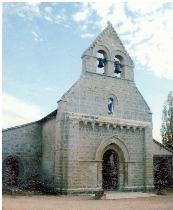
Londigny (Charente) Église Saint-Hilaire 1. Plan (B. Moulinier, 2001) 2. Façade occidentale