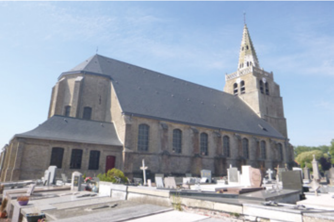
4. Vue nord-est de l'église après restauration