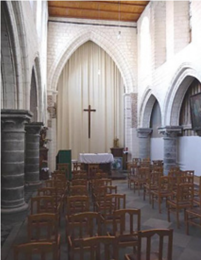
7. Vue intérieure vers le chœur