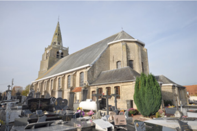
3. Vue sud-est de l'église avant restauration