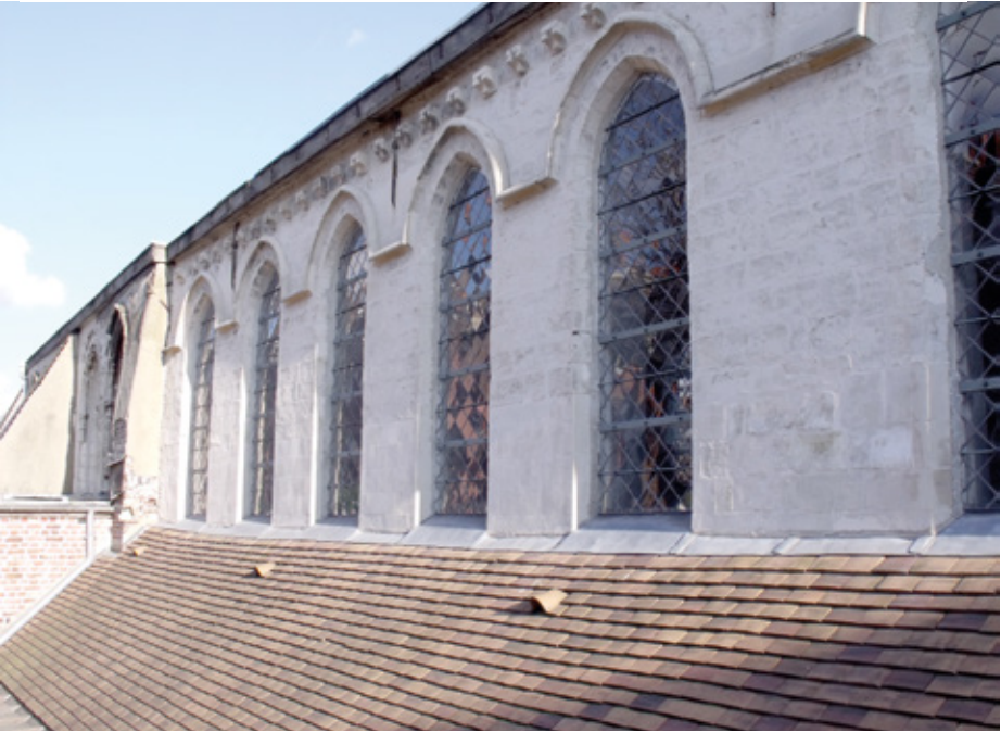
3. Façade nord restaurée