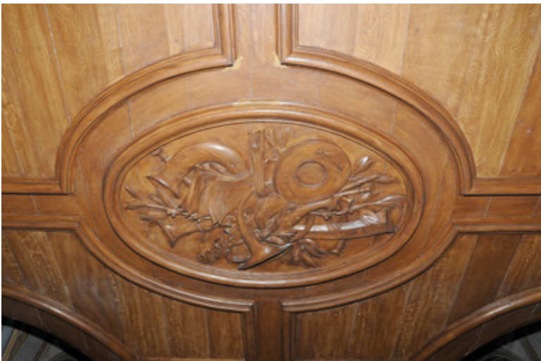
9. Détail du plafond sous la tribune