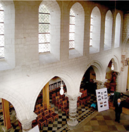
5. Vue intérieure vers le bas-côté nord