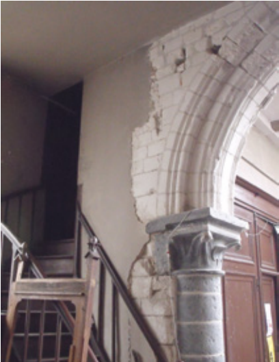
6. Détail de l'une des arcades néogothiques