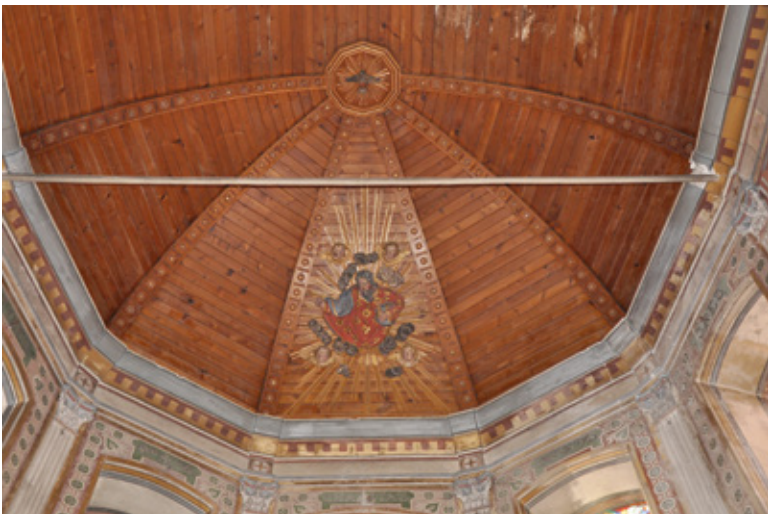
8. Voûte lambrissée du chœur