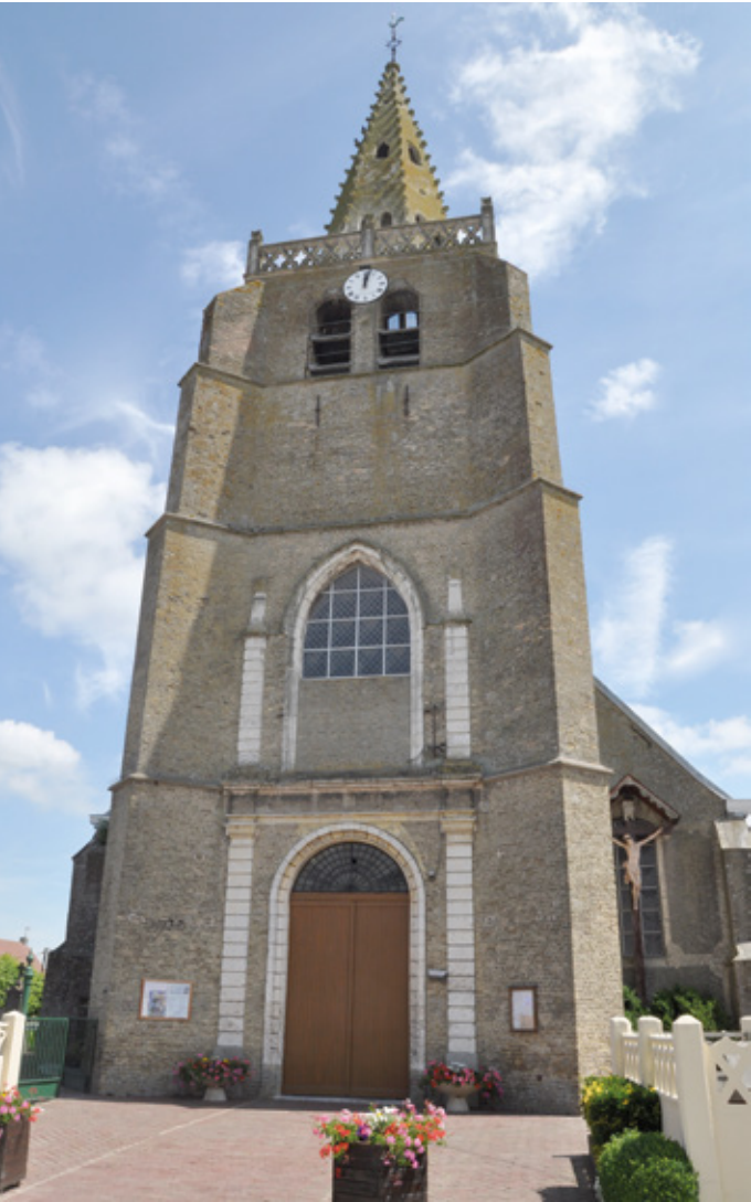
2. Façade occidentale