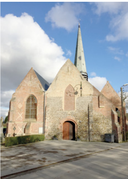
3. Façade occidentale