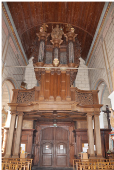
7. Vue intérieure de l’entrée et du buffet d’orgue