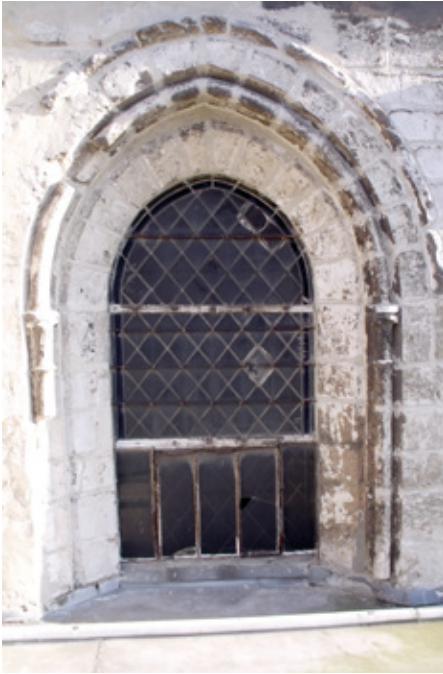
4. Baies nord du chœur