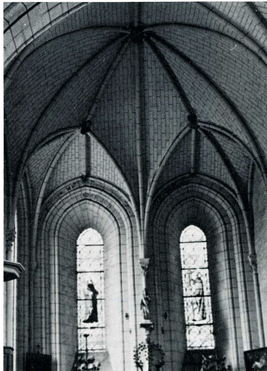
Louvaines (Maine-et-Loire). Chapelle Notre-Dame de la Jaillette.

photographies jointes à l'important dossier constitué par l'Association culturelle du Val d'Odon. La partie orientale de l'église est un bel exemple de l'architecture dite « Plantagenet ». Des peintures murales du xv e s. représentent saint Fiacre appuyé sur sa bêche de jardinier et le martyr de saint Blaise. Toitures et gros œuvres ont besoin de réparations urgentes. La Sauvegarde a donné une subvention de 50 000 F en espérant une aide semblable du Département.