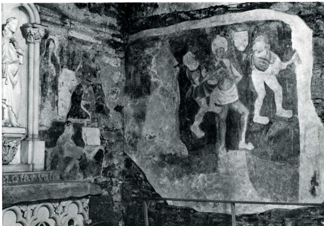
Louvainnes (Maine-et-Loire). Chapelle Notre-Dame de la Jaillette.