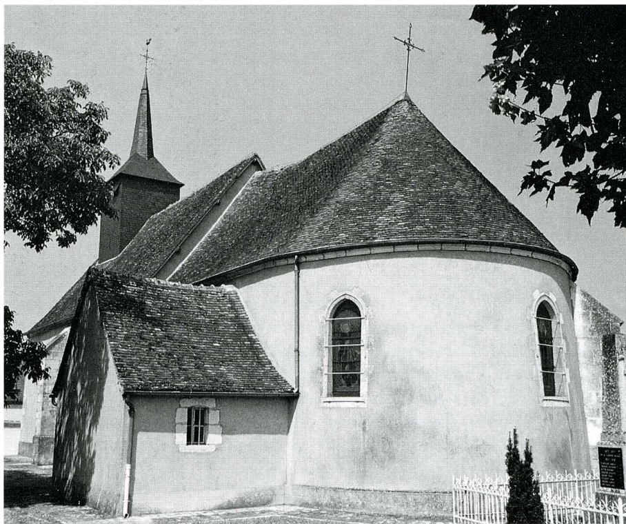
Lugny-Champagne (Cher). Église Saint-Fiacre. 1- Charpente. 2- Abside.