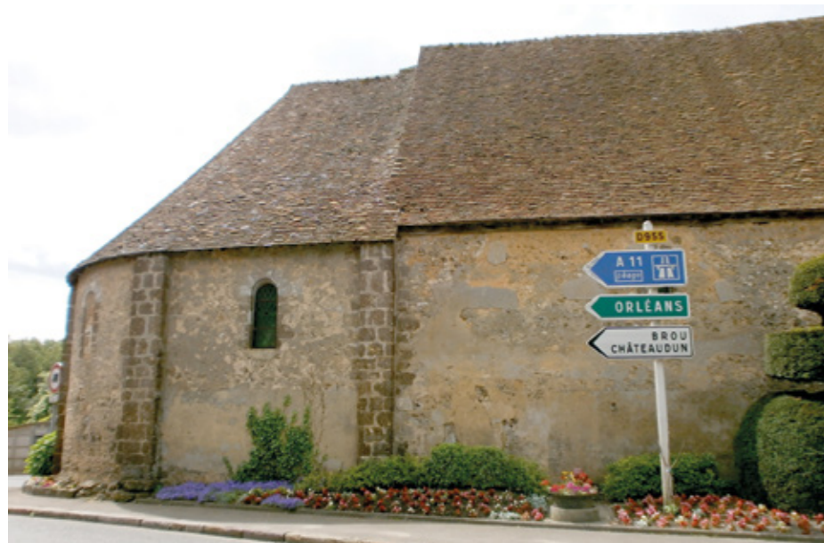
4. Façade nord

d'une rosace appareillée d'élégants entrelacs. Un clocher massif en ardoise, percé d'abat-sons géminés, surplombe la toiture de l'église, en tuile plate. En raison de l'accroissement de la paroisse au xvi e siècle, le sieur Pierre de Saint-Berthevin fit entreprendre vers 1550 l'agrandissement de l'édifice par la construction d'une chapelle composée de deux travées