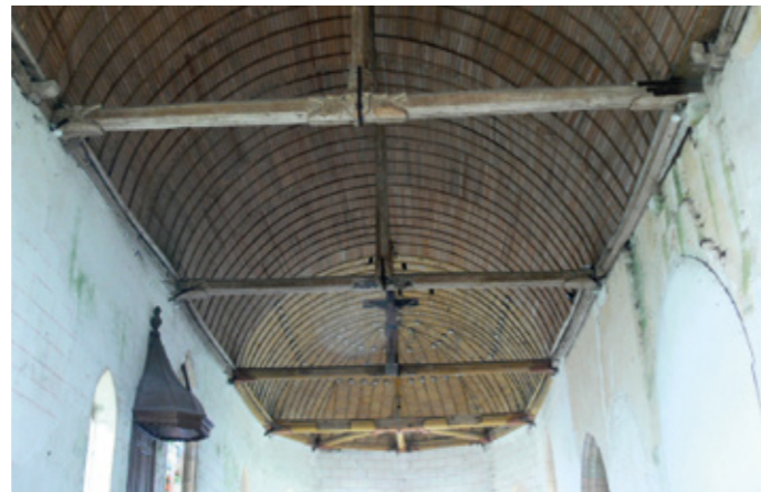
7. Couvrement de la nef et du chœur