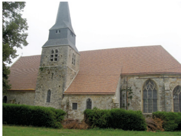
4. Façade sud