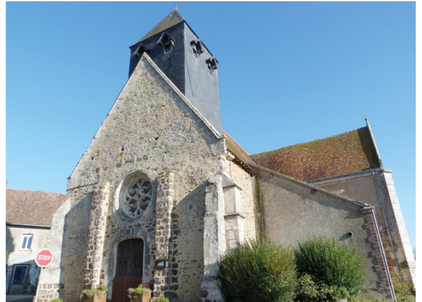
1. Façade ouest

Canton Brou, arrondissement Nogent-le-Rotrou, 387 habitants