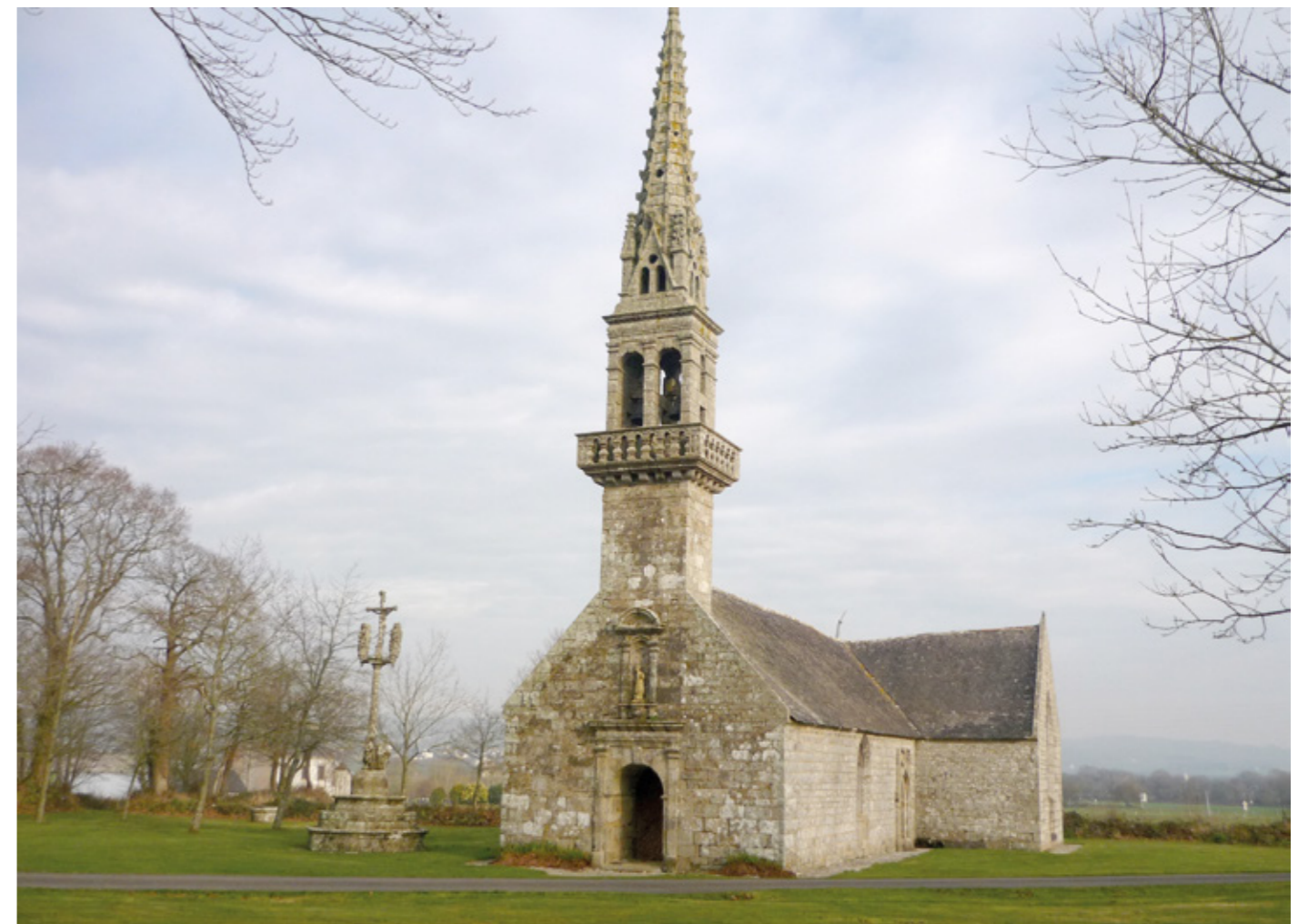
1. Vue sud-ouest

Canton Crozon, arrondissement Châteaulin, 1620 habitants