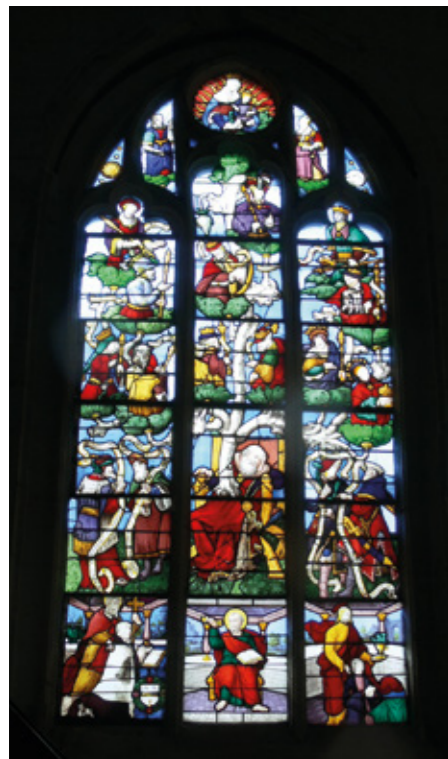
8. Vitrail, xv e siècle : l'Arbre de Jessé

Seule la représentation de l'Arbre de Jessé (cl. MH), au nord, apparaît complète mais fortement restaurée en 1872.