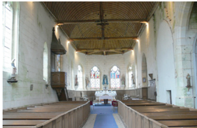
6. Vue intérieure vers le chœur