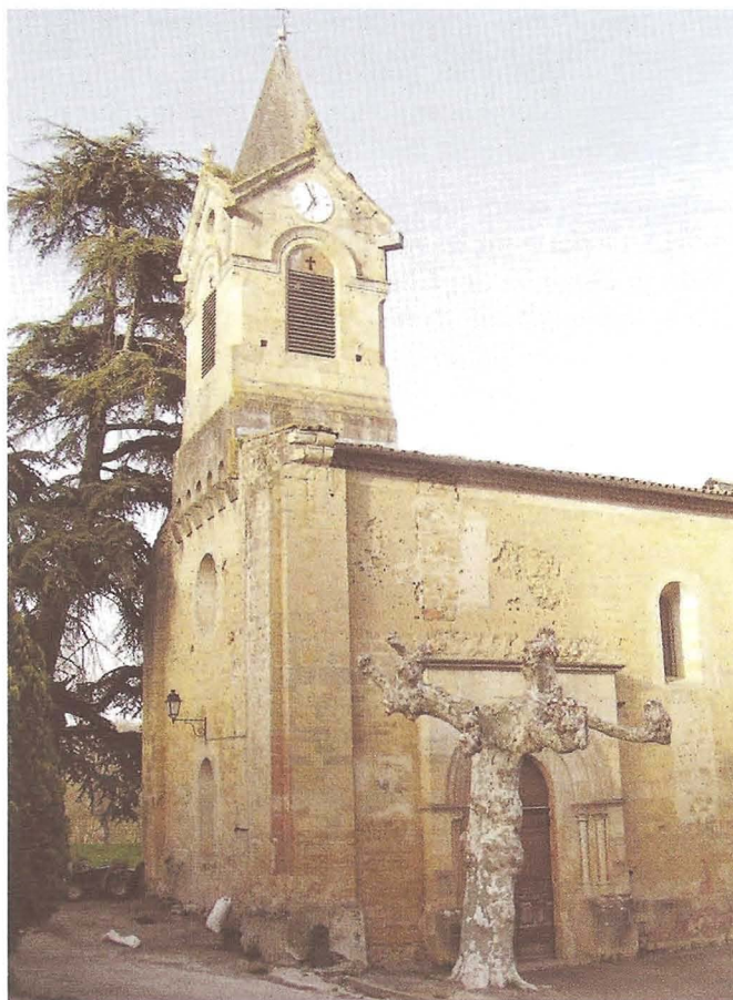
Manges (Ariège) Église Saint-Jean-Baptiste 1. Façades ouest et sud

Ce prieuré de Manges se trouve sur un des chemins de Saint-Jacques. Il eut beaucoup à souffrir des troubles de la guerre des Albigeois. Le catharisme, très répandu à Mirepoix et dans les environs, est à l'origine de sa réduction en prieuré simple par l'abbé de Montolieu 1 .