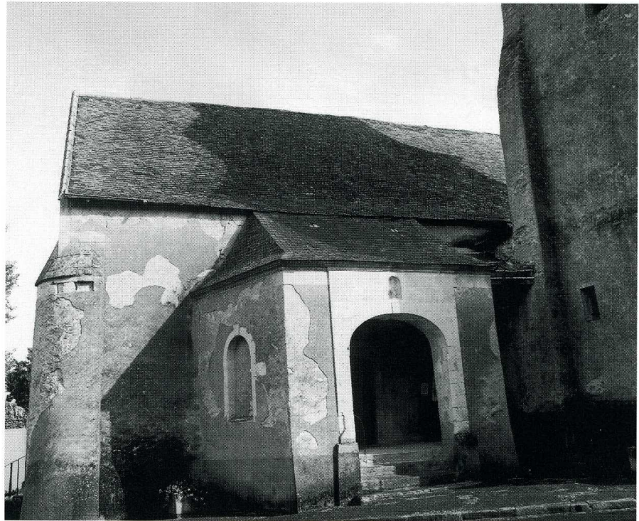
Marcé (Maine-et-Loire). Eglise Saint-Martin. 1. Porche sud, cl. Paillat. 2. Vue intérieure vers l'abside, cl. Paillat