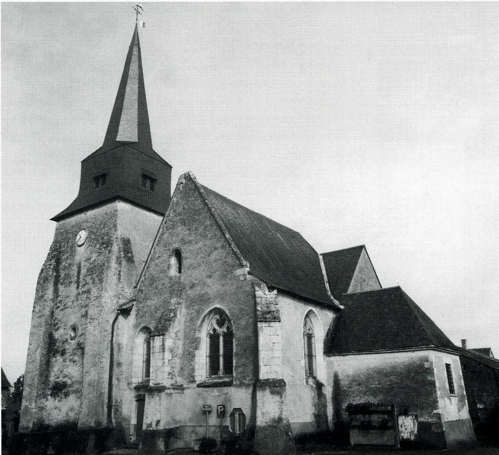
Marcé (Maine-et-Loire). Eglise Saint-Martin. 1. Plan, éch. 0,01. 2. Chevet et clocher, cl. Paillat.