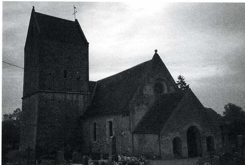
Marcei (Orne). Église Saint-Ouen, chevet et vue d'ensemble du nord-ouest.

L' ÉGLISE paroissiale de Marcei, dédiée à saint Ouen, est un édifice bâti à l'époque romane sur un plan rectangulaire très allongé (34 m sur 7,30 m). Un imposant clocher, de structure très massive avec salle haute et toiture en batière, joute la nef au nord. C'est sans doute la partie la plus ancienne du monument, dont la nef a subi de nombreux remaniements, jusqu'à une époque qui semble assez récente. L'église est entourée de son vieux cimetière, où l'on peut voir une croix hosannière du XVIII e s. Elle n'a fait l'objet d'aucune mesure de protection, mais abrite deux statues en pierre polychromée du XVII e s. qui ont été classées au titre des objets mobiliers (Vierge à l'Enfant et saint Ouen).