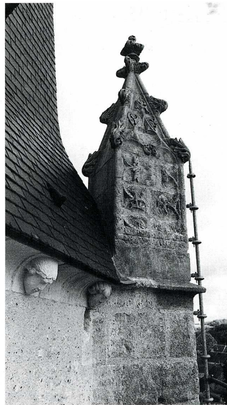
Marçon (Sarthe). Église Notre-Dame, modillon et pinacle du clocher.

campagnes de construction. Sur la façade sud s'élève un intéressant clocher datant du XV e s. Les contreforts à ressaut qui le cantonnent sont surmontés de pinacles en pierre de tuffeau qui encadrent une flèche en charpente couverte d'ardoises. Une corniche en pierre, ornée de modillons sculptés de figures humaines, ceinture cette tour.