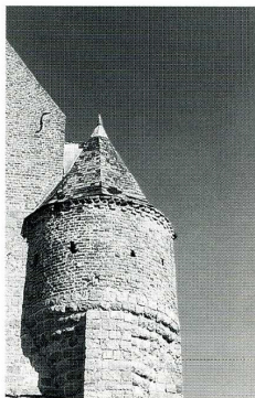
Marly-Gomont (Aisne), église Saint-Remi. Tourelle sud de la façade occidentale.

Église Saint-Remi. Un autel est mentionné dès 1134 à Marly. La plus ancienne mention de la paroisse date de 1241, mais l'église actuelle est nettement plus tardive. Elle se rattache au groupe si caractéristique des églises de la Thiérache qui furent fortifiées aux XVI e -XVII e s., pour permettre aux populations locales de résister aux coups de mains des armées et des bandes de pillards qui écumaient la région à la faveur des troubles politiques et militaires, particulièrement aigus dans cette région frontalière. En témoignent ici les canonnières percées au bas des murs gouttereaux de la nef.