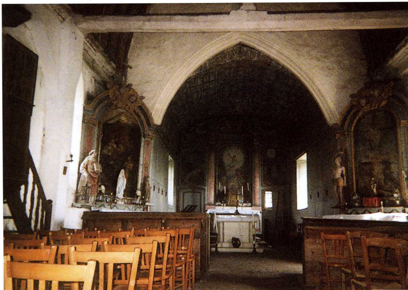
Marnefer (Orne) Église Saint-Laurent 1. Vue sud-ouest et porche de l'église 2. Voûte de la nef 3. Vue intérieure vers l'abside