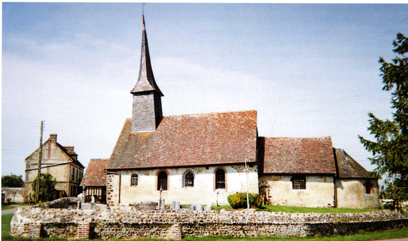
Marnefer (Orne) Église Saint-Laurent Façade sud de l'édifice