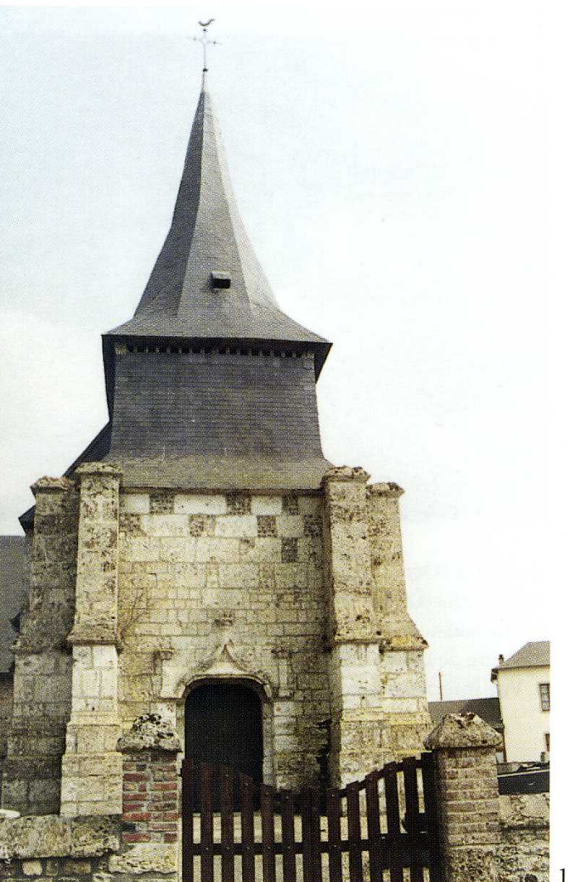
Martainville (Eure) Église Saint-Pierre 1. Façade occidentale 2. Porte du clocher 3. Chapelle nord

La nef et les chapelles latérales sont couvertes d'une voûte en bardeau. Les lambris de revêtement sont peints de fleurs de lys et de feuilles de trèfle blanches sur fond brun. Des lignes blanches et