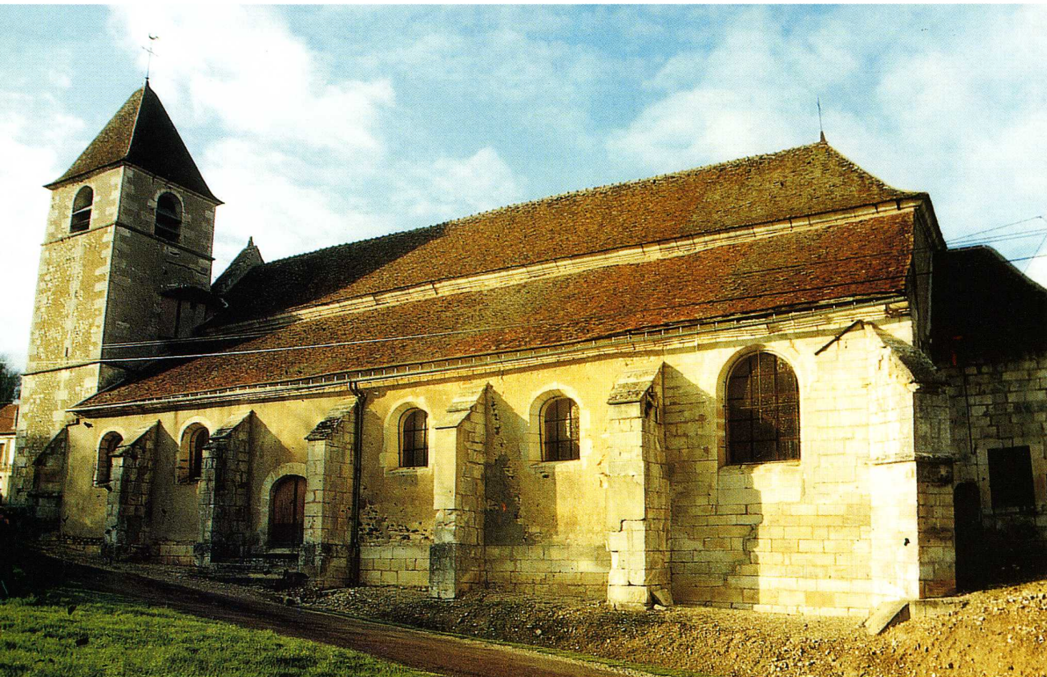
Merry-Sec (Yonne) Église Saint-Menge Façade sud (cl. H. Cazelles, arch.)

Yonne, canton Courson-les-Carières, arrondissement Auxerre, 143 habitants I.S.M.H. 1997