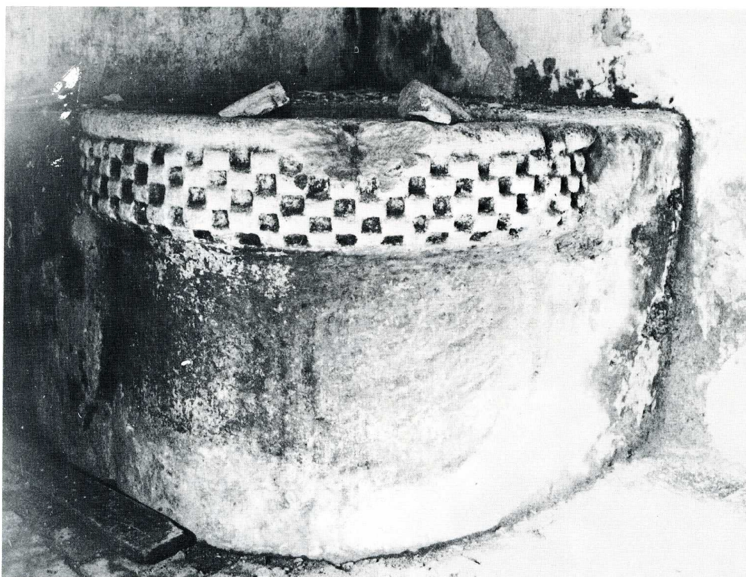
Miramont-Sensacq (Landes). Église paroissiale Saint-Jacques-de-Sensacq.

mériteraient une étude. L'architecture intérieure est d'une austérité voulue par la perfection de sa structure. La disposition du chevet droit mérite particulièrement l'admiration. Pour parer aux dangers procurés par la déclivité du terrain, ce chevet a été doublé d'une arcature aveugle. L'arcade centrale, également aveugle, rappelle d'autant plus un arc de triomphe que certains de ses éléments font largement saillie. On notera d'autre part les belles proportions des chapelles latérales terminées par des absides en plein cintre. Une cuve baptismale décorée de rangées de billettes est conservée dans l'angle nord-ouest de la nef. Presque tout l'édifice exige une mise hors d'eau soigneusement exécutée. Le devis se monte à 90 300 F. La Sauvegarde de l'Art Français a accordé une subvention de 50 000 F.