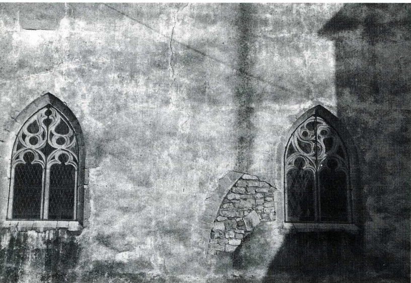
Le Miroir (Saône-et-Loire).