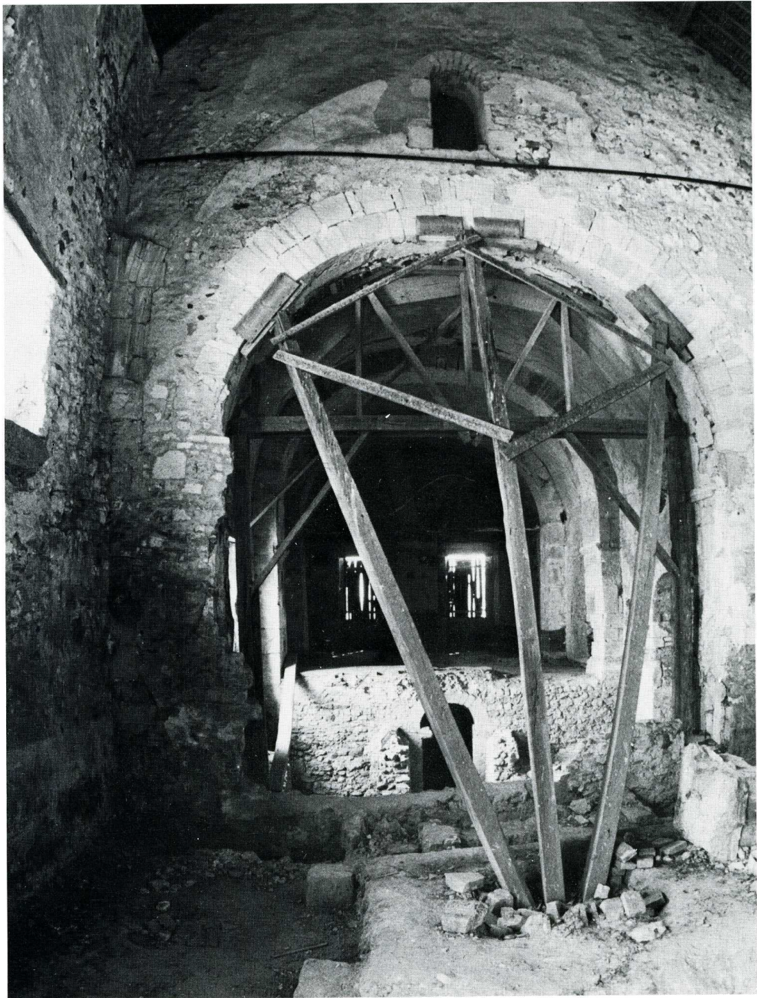
Montereau-Faut-Yonne (Seine-et-Marne). Ancien prieuré de Saint-Martin-du-Tertre.