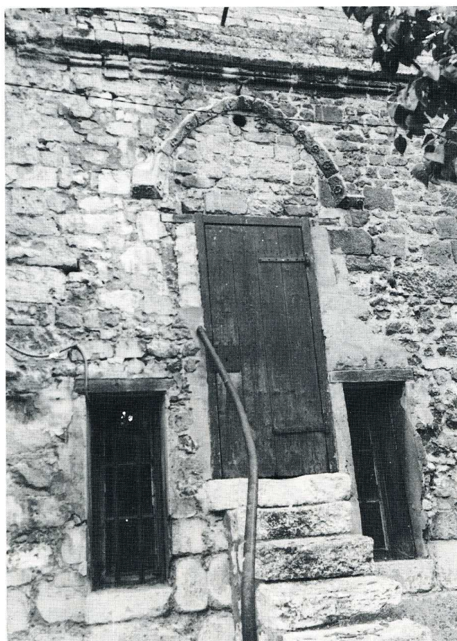
Moyvillers (Oise). Église Saint-Martin.

reconstruite au XVII e s. après les déprédations des troupes espagnoles, ont été pourvus de superbes boiseries qui ont été sculptées en même temps que le maître-autel portant la date de 1703 et que le banc d'œuvre dont l'élégante disposition est très originale. Frappé par la foudre, le clocher nécessite une réfection urgente. D'autres travaux de maçonnerie sont souhaitables sinon nécessaires. Nous avons proposé une subvention de 30 000 F. L'Association de sauvegarde locale a su réunir une contribution de 12 720 F. On ne saurait trop l'en féliciter.