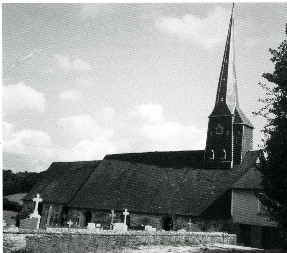
Neuville-sur-Touques (Orne), église Saint-Germain, façade nord de l'église et clocher.