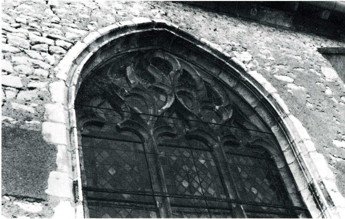
Neuivy-sur-Loire (Nièvre). Ancienne chapelle Saint-Claude.