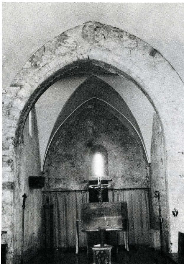
Nissan-lez-Ensérune (Hérault). Chapelle Notre-Dame de Miséricorde.