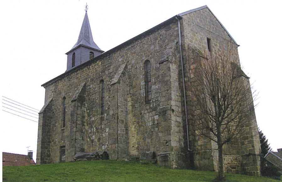
Fransèches (Creuse) Église Saint-Denis Façade sud-est

Creuse, canton Saint-Sulpice-les-Champs, arrondissement Aubusson, 271 habitants I.S.M.H. 1969