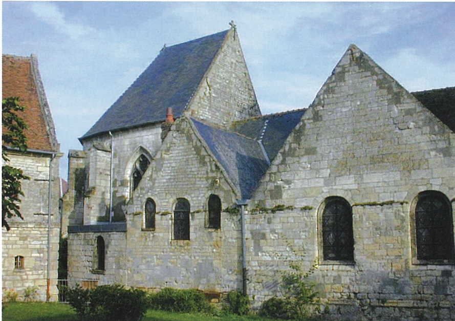
Léglantiers (Oise) Église Saint-Eloi Façade nord

Oise, canton Maignelay-Montigny, arrondissement Clermont, 550 habitants I.S.M.H. 1927 (chœur et clocher)