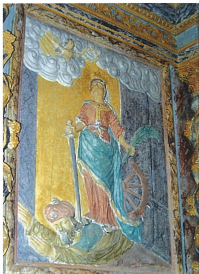
Ornezan (Gers) Église Sainte-Catherine Sainte Catherine d'Alexandrie, détail du retable

Arch. dép. Gers, V 303, V 1100 – Dossier archéologique Auch S.E. Ornézan.