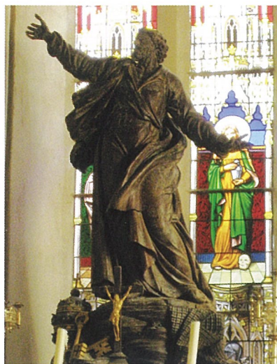
Statue de saint Pierre