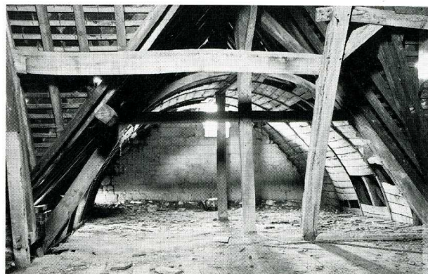
Nouvion-et-Catillon (Aisne). Église Saint-Denis de Pont-à-Bucy. Vestiges de l'ancienne voûte lambrissée.