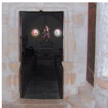
Nuars (Nièvre) Église Saint-Symphorien 1. Façade nord et clocher 2. Portail occidental