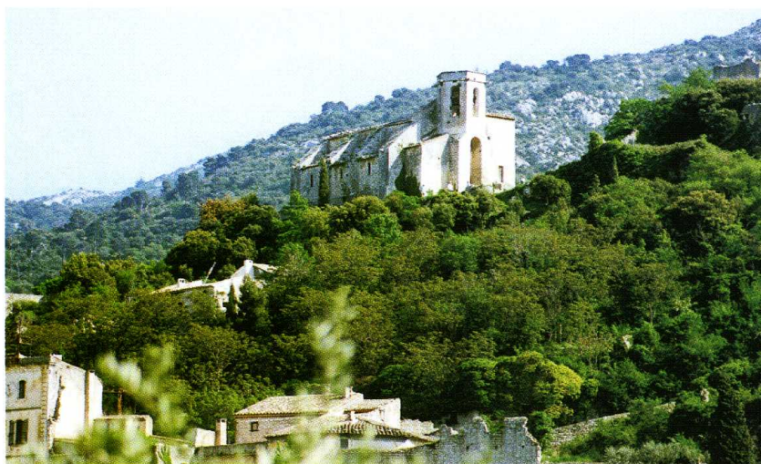
Oppède (Vaucluse) Église Notre-Dame d'Alidon 1. Vue de la collégiale depuis la colline [qui la surplombe] 2. La collégiale à flanc de colline