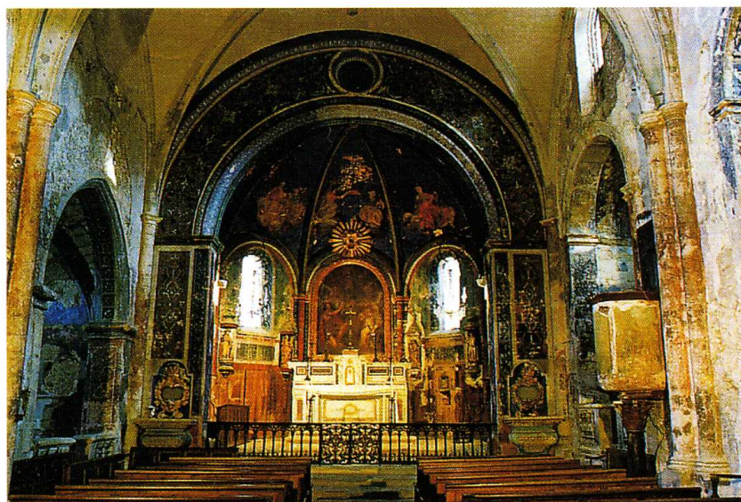
Oppède (Vaucluse) Église Notre-Dame d'Alidon 1. Vue intérieure vers l'abside 2. Plan (E. Fannièrre, ABF) 1993