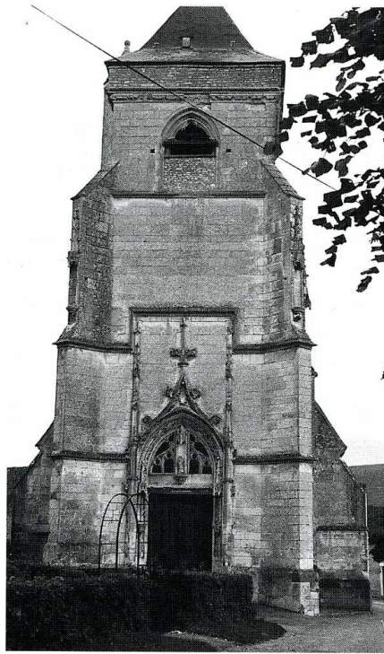
Ouanne (Yonne). Église Notre-Dame, clocher-porche et voûtes du déambulatoire.