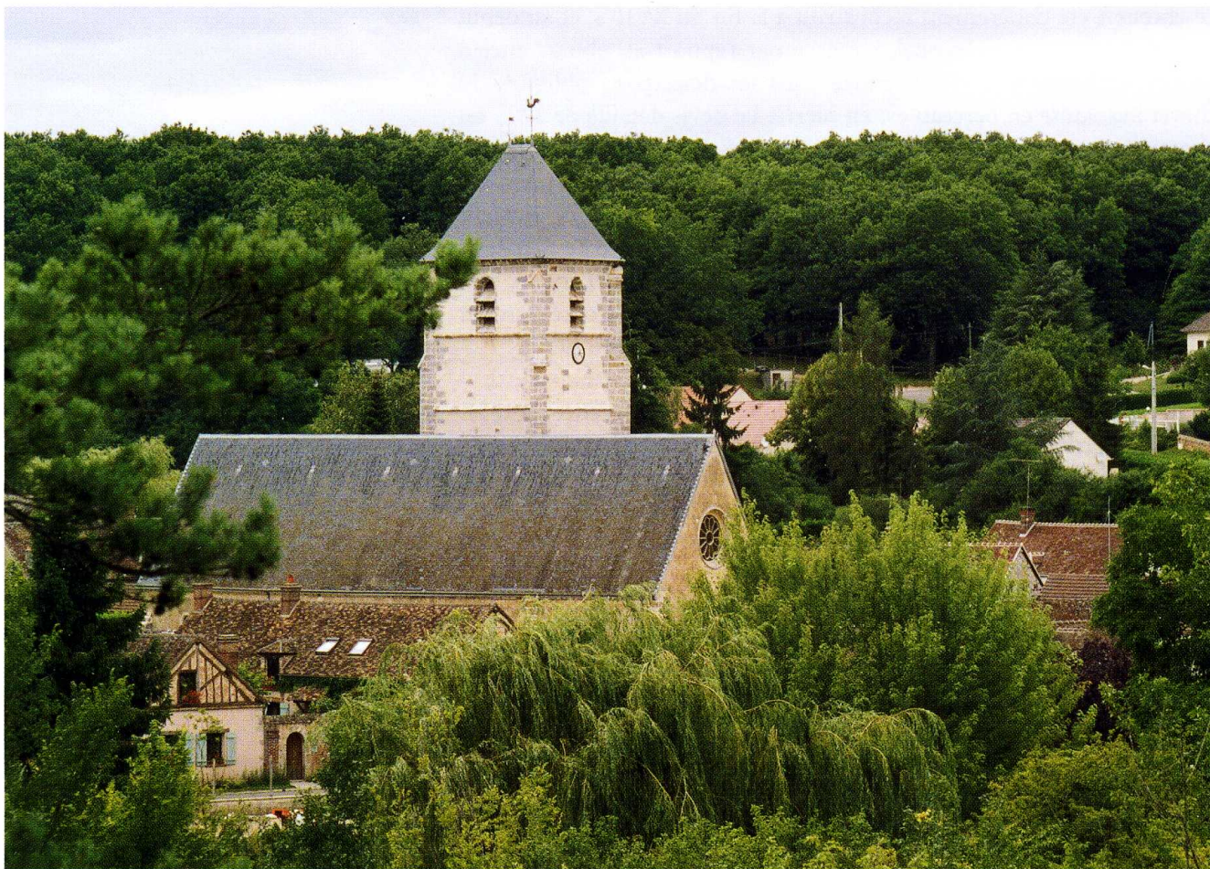
Ouerre (Eure-et-Loir) Église Saint-Cyr-et-Sainte-Julitte 1. L'église dans le village