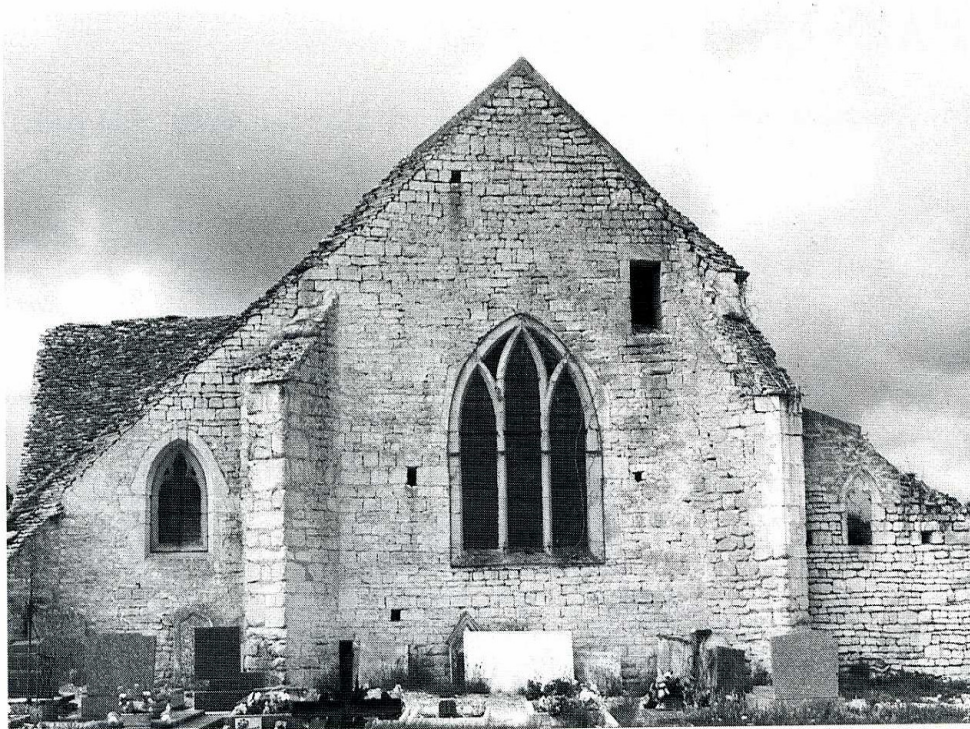
Pacy-sur-Armançon (Yonne). Chapelle du cimetière, chevet.

L A CHAPELLE du cimetière de Pacy appartenait autrefois à un ensemble fortifié possédé par la famille de Souvre, apparentée aux Louvois, et dont il subsiste quelques traces dans le village. Cette forteresse avait été construite au XII e s., mais la chapelle date du siècle suivant, alors que les vicomtes de Saint-Florentin étaient seigneurs de Pacy. C'est un édifice bâti dans les matériaux traditionnels du Tonnerrois : murs en pierres sèches et couvertures en laves. Il se compose de trois travées rectangulaires. La première est aujourd'hui effondrée, et seuls subsistent des pans de murs. Les deux suivantes sont séparées par un arc doubleau et couvertes de voûtes sur croisée d'ogives. Le chœur est