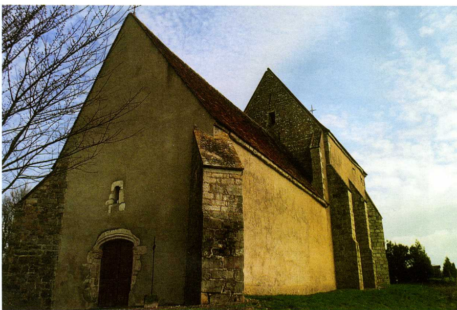
Paroy-sur-Tholon (Yonne) Église Saint-Pierre Vud du sud-ouest

On remarque un étonnant Calvaire en tilleul et une Pietà en pierre polychrome du XV e siècle.