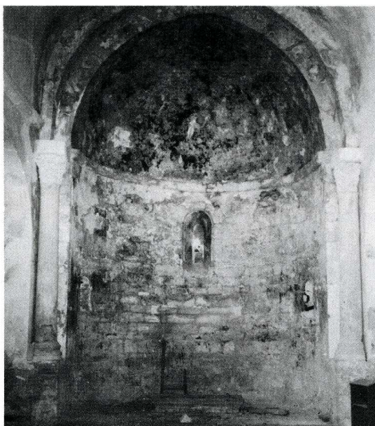
Le Pègue (Drôme). Chapelle Sainte-Anne.