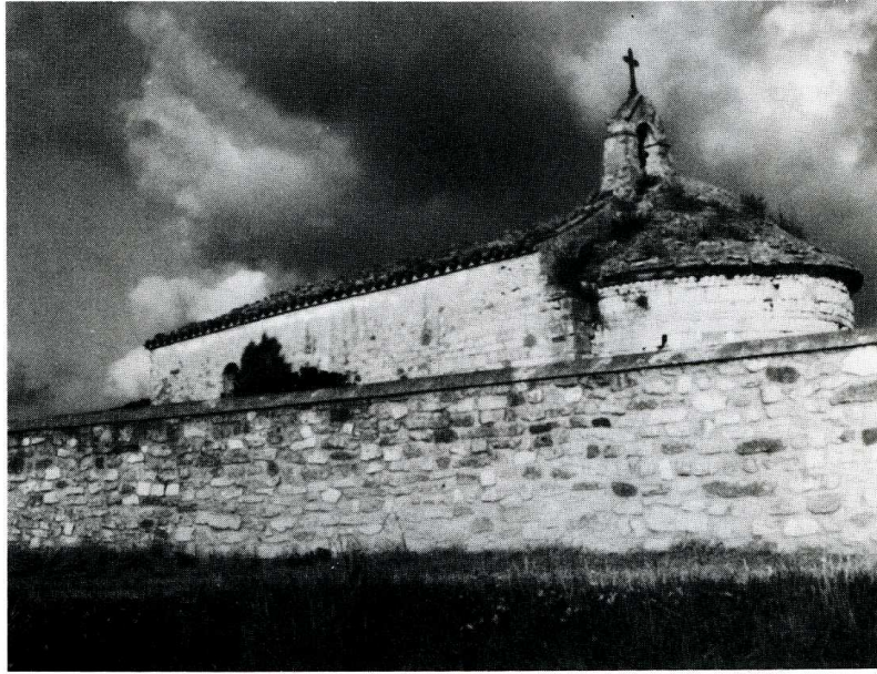
Le Pègue (Drôme). Chapelle Sainte-Anne.