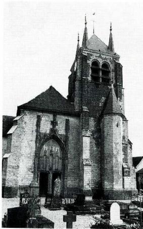
Pel-et-Der (Aube). Église de l'Assomption de la Vierge, façade occidentale.