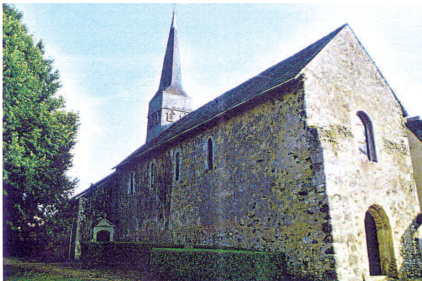
Pincé (Sarthe) - Église Saint-Aubin L'église vue du nord-ouest

sons, légèrement surbaissée. Un passage, dont le tracé est biais, fait communiquer la sacristie avec la chapelle sud.