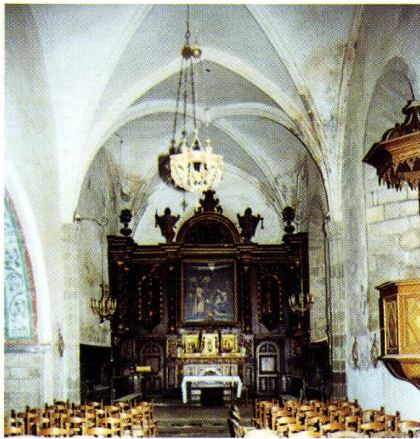
Pionnat (Creuse) Église Saint-Martin de Tours Vue intérieure vers le chœur 2000

A. Lecler, Dictionnaire topographique, archéologique et historique de la Creuse , Limoges, 1902 (reprint, Marseille, 1979), p. 515-518.