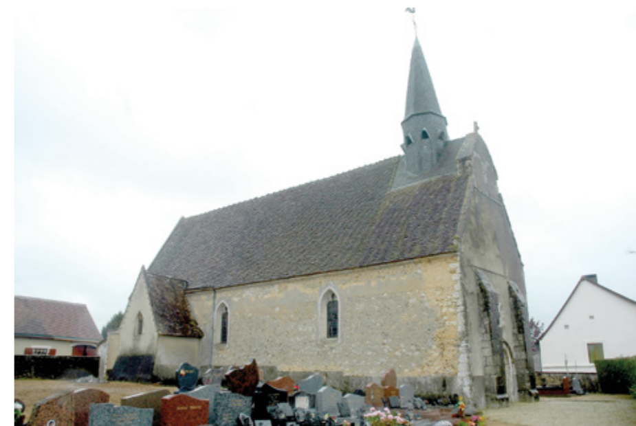
1. Vue sud-ouest

À peu de distance de l'église s'élève la « maison du Cœur », logis appelé ainsi en raison d'un cœur sculpté sur sa façade, qui porte également les armes des Le Voyer.