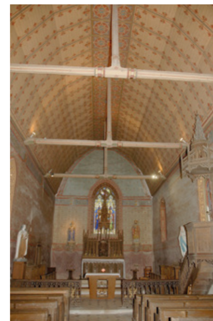
2. Vue intérieure vers le chœur