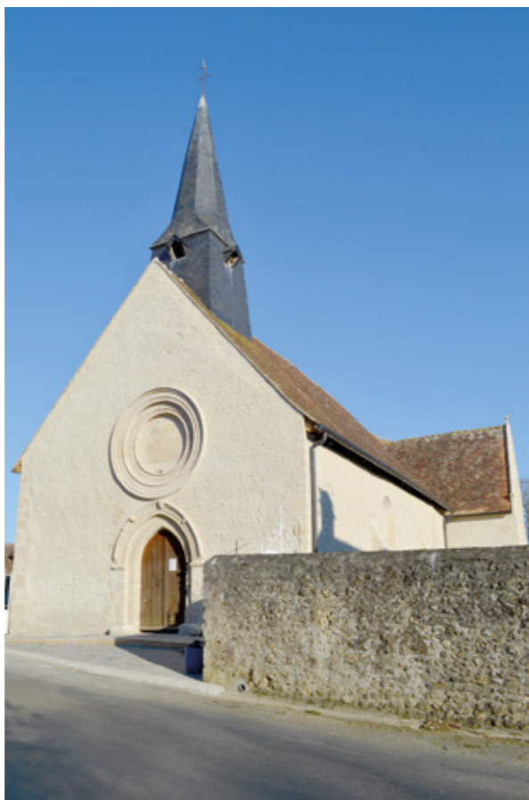
1. Façade sud-ouest après restauration

L'ÉGLISE SAINT-REMY figure sur le cartulaire de l'abbaye Saint-Vincent du Mans, cependant, comme à l'ordinaire, c'était l'évêque du Mans qui avait la collation du curé. De plan rectangulaire, elle comporte une nef unique et un chevet droit éclairé par un triplet, qui a été occulté par la mise en place d'un autel majeur. L'église a été agrandie aux xv e et xvi e siècles de deux chapelles, placées au nord et au sud de la nef. Elle possède quelques éléments mobiliers remarquables : un Christ en croix et une sainte Anne, en pierre ( xvi e siècle) ; le tympan d'un vitrail, ouvert dans le mur sud, figurant les anges portant les instruments de la Passion ( xvi e siècle) ; une piéta en pierre ( xvi e ou xvii e siècle) ; une Charité de saint Martin, en pierre ( xv e siècle) ; deux statues en bois ( xviii e siècle), saint Léon Fort, pape, et saint Jacques (identifié par erreur comme saint Martin). Bénéficiant d'une politique du Conseil général de la Sarthe en faveur des artistes contemporains, huit baies dans cette église ont été confiées à Michel Madore (Montréal, 1949-).