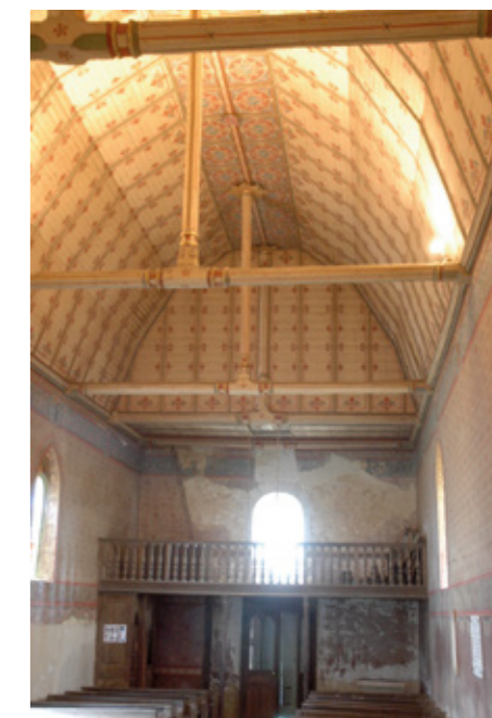
3. Vue intérieure vers l'entrée, voûte lambrissée peinte

Les travaux ont permis l'étaielement du clocher et le contrebutement du mur pignon occidental, qui se déversait. La Sauvegarde de l'Art français a accordé, en 2019, une aide de 8 000 € pour l'étaielement et la reprise des étanchéités du clocher.