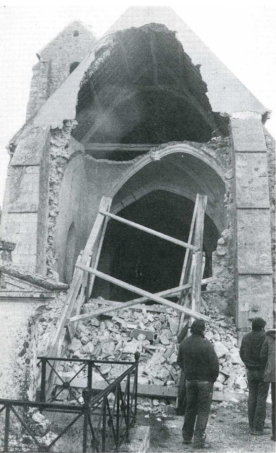
Le Plessy-Placy (Seine-et-Marne).

Bibliographie. — BENOIST (L.) et SARAZIN (J.-B.), Notice historique et statistique sur le Plessy-Placy, Meaux, 1888.