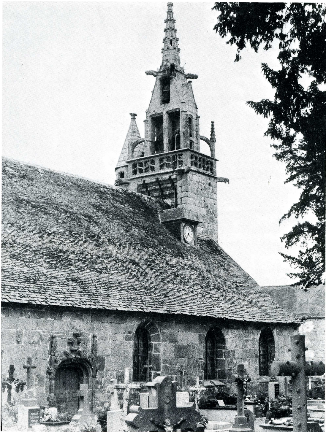
Plouegat-Guerrand (Finistère). Église Saint-Agapit.