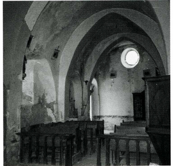
Le Poët-Sigillat (Drôme). Église Saint-Martin, vue d'ensemble côté sud et intérieur de la nef.