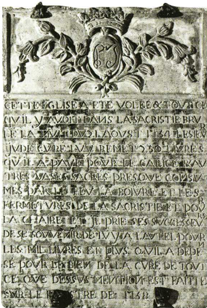
1. Pouques-Lormes (Nièvre) Église Saint-Pierre-aux-Liens 1. Inscription commémorative du vol commis en 1754 2. Façade nord et clocher

Nièvre, canton Lormes, arrondissement Clamecy, 120 habitants