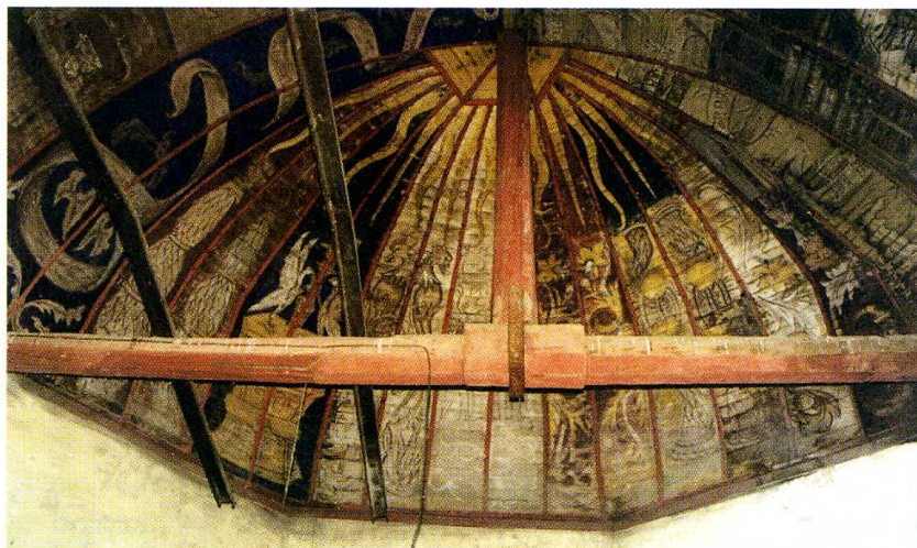
Pourrain (Yonne) Chapelle Saint-Baudel Voûte lambrissée sur l'abside

différents endroits la même devise écrite en lettres gothiques : Bien faire, lesser dire . Divers sondages laissent penser que les murs portaient également des motifs peints. La construction de la chapelle et la décoration de la voûte semblent bien contemporaines et se situent probablement à la fin du XVI e siècle. Dans le pan sud du mur de l'abside a été sculptée une piscine ornée d'un trilobe.