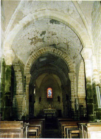
Pouzy-Mésangy (Allier) Église Saint-Aignan Vue intérieure vers l'abside

La nef et les bas-côtés furent édifiés à la fin du XI e s. ou au début du XII e s., alors que les voûtes furent élevées à diverses époques.