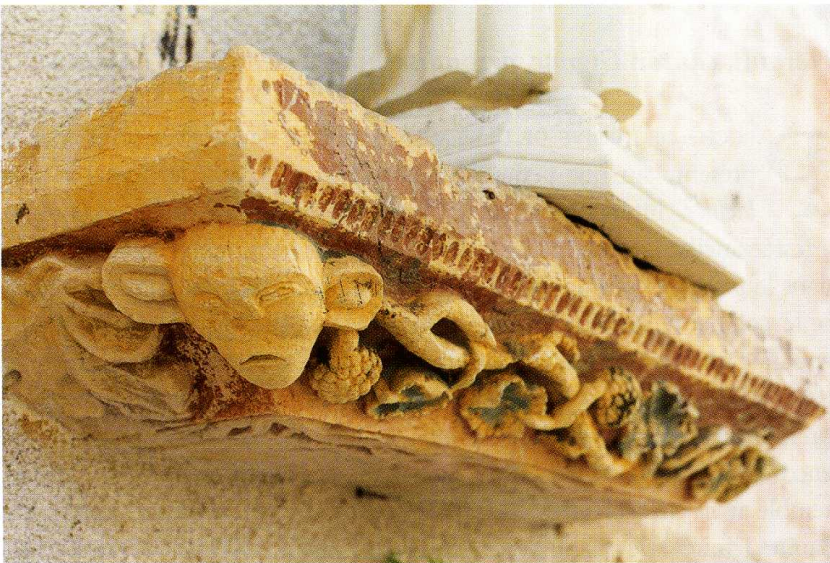
M. Quantin, Répertoire archéologique du département de l'Yonne , Paris, 1868, col. 26. M. Pignard-Péguet, Histoire de l'Yonne , Paris, 1913, p. 549. (Réimpr. : Histoire des communes de l'Yonne , 01960 Péronnas, 1998.)