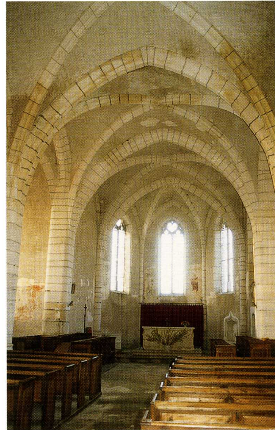
Préhy (Yonne) Église Notre-Dame 2. Plan (A. Leriche, arch., 2001) 3. Vue générale de l'intérieur vers le chœur (cl. A. Leriche, arch.) 4. Éléments de corniche provenant de l'ancienne église carolingienne (cl. P. Henry)