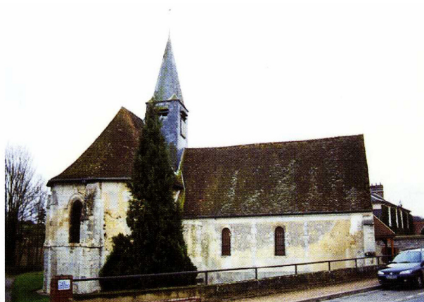
Puisseux-le-Hauberger (Oise) Église Saint-Germain 1. Le chevet