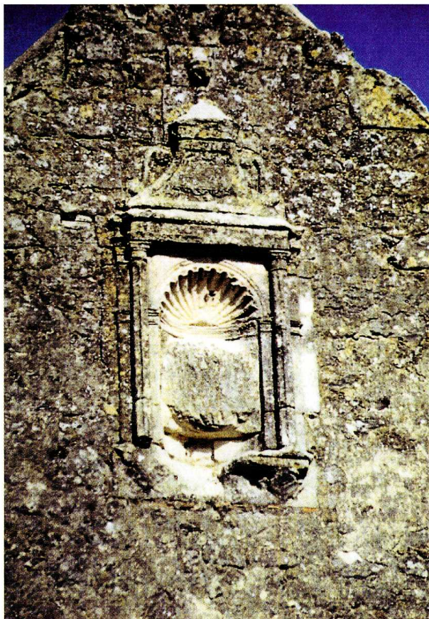
Requeil (Sarthe) Église Saint-Pierre Niche du pignon de la chapelle sud

D. Latron, Requeil, Église Saint-Pierre, rapport de diagnostic, juin 1993, ill., 50 p.