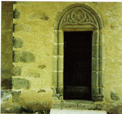
Rilhac-Lastours (Haute-Vienne) Église Sainte-Marguerite Porte de la sacristie provenant de l'église Sainte-Croix

Ch. Remy, Lastours en Limousin, de l'an Mil à la Renaissance , Tulle, 1991 (n° spécial de Lemouzi , 120 bis), p. 13.