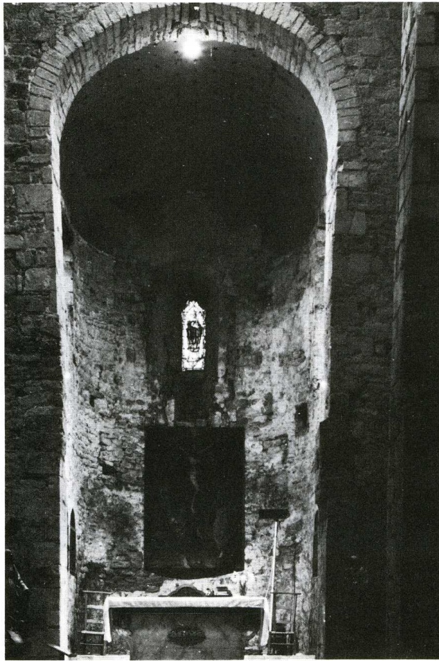
Rocamadour (Lot). Église Saint-Martin à Mayrinhac-le-Francal.