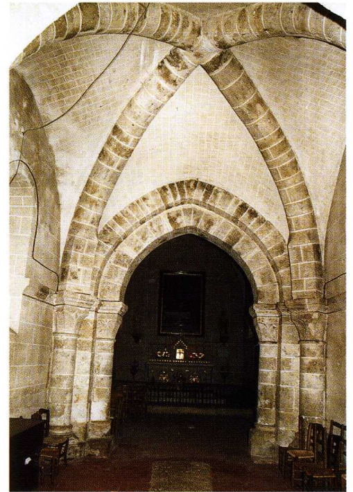
Rogny-les-Sept-Écluses (Yonne) Église Saint-Loup 2. Plan (A. Leriche, arch., 2001) 3. Travée supportant le clocher

M. Quantin, Répertoire archéologique du département de l'Yonne , Paris, 1868, col. 132-133.